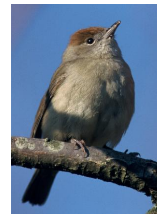
Fauvette à tête noire